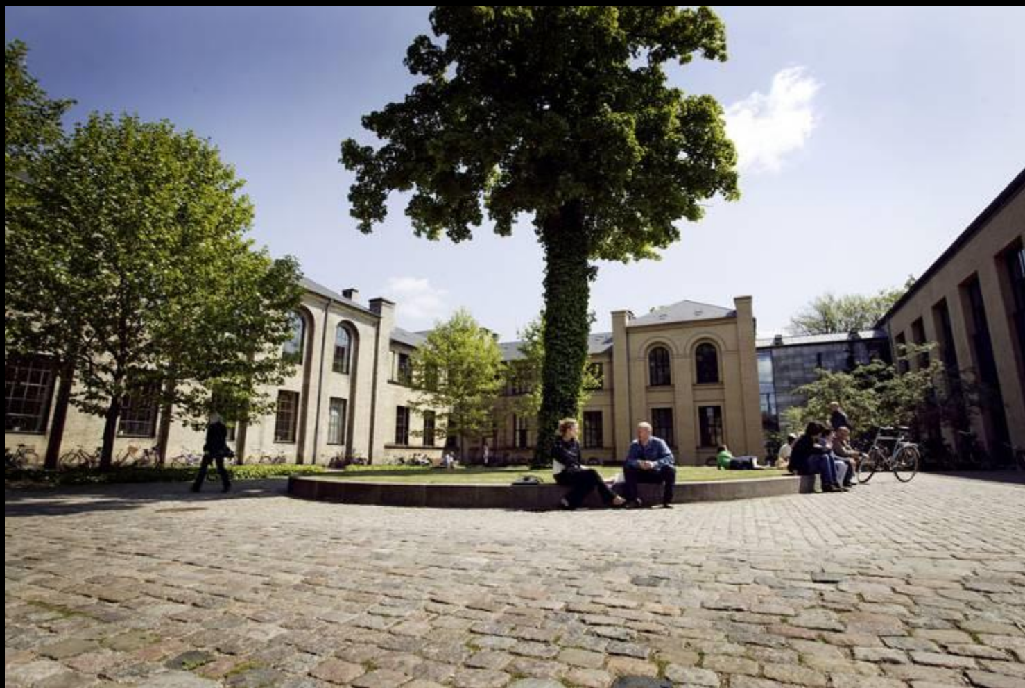
Foulum, d. 26. maj Dias 18